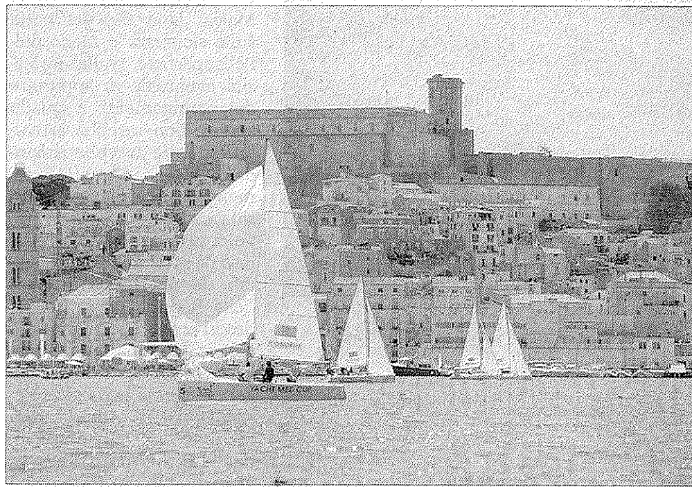
Un momento delle scorse edizioni dello Yacht Med Festival

Uno sforzo organizzativo complesso per valorizzare l'Economia del Mare come motore per il rilancio di tutto il Lazio